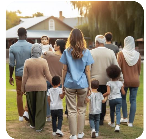
KI-generiertes Bild mit Dall·E3