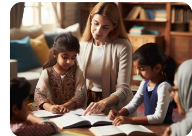
KI-generiertes Bild mit Dall·E3